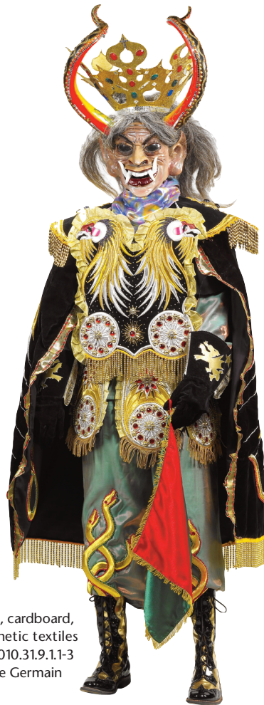
Naupa Diablo costume Oruro (Bolivia), 2000

Les fêtes d'Oruro en Bolivie en Amérique du sud.