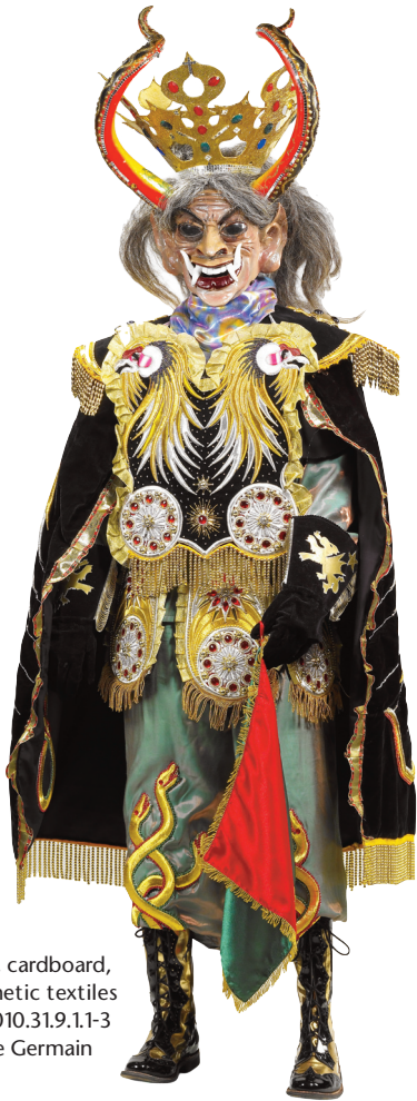
Naupa Diablo costume Oruro (Bolivia), 2000 Plaster, polychrome, horsethair, glassware, cardboard, synthetic beads, synthetic textiles Paris, Musée du quai Branly - Jacques Chirac - 70.2010.31.9.1.1-3