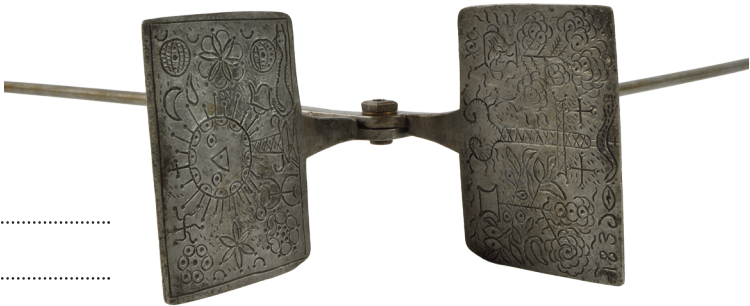
Moule à gaufres - France, 1830 - Fer forgé Marseille, Mucem - 1963.174.7

16 - À partir du texte et de la table tactile, complète le tableau ci-dessous :