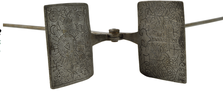
Moule à gaufres - France, 1830 - Fer forgé Marseille, Mucem - 1963.174.7

Le mardi gras, on mange des beignets, des gaufres et des crêpes, des aliments gras et on se déguise avant le début du Carême.